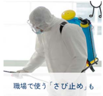
職場で使う「さび止め」も