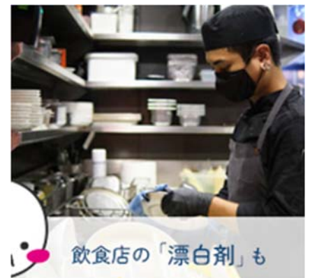
飲食店の「漂白剤」も