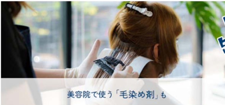
美容院で使う「毛染め剤」も