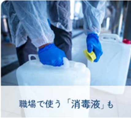
職場で使う「消毒液」も