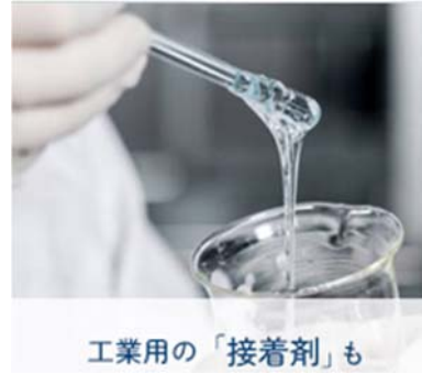
工業用の「接着剤」も