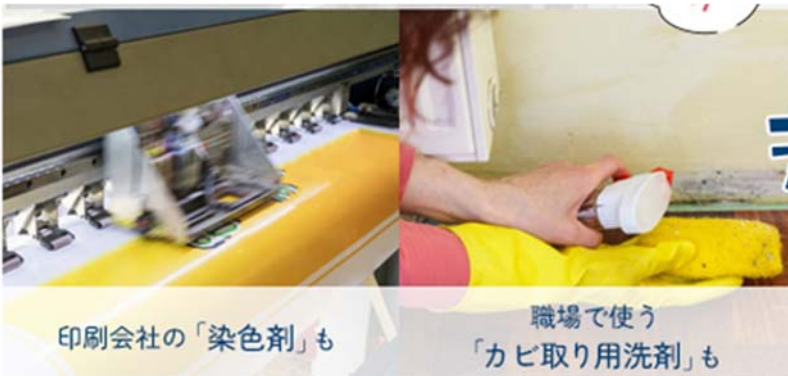
印刷会社の「染色剤」も