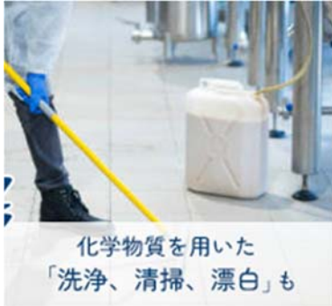
化学物質を用いた 「洗浄、清掃、漂白」も