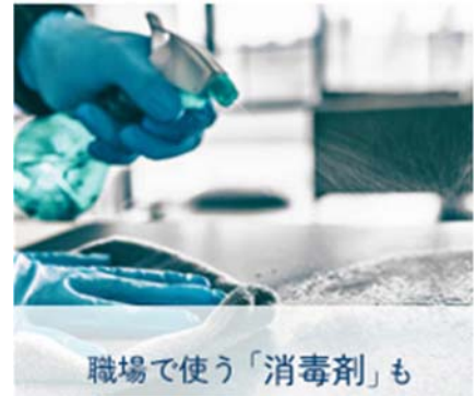
職場で使う「消毒剤」も