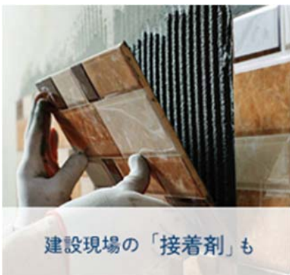
建設現場の「接着剤」も