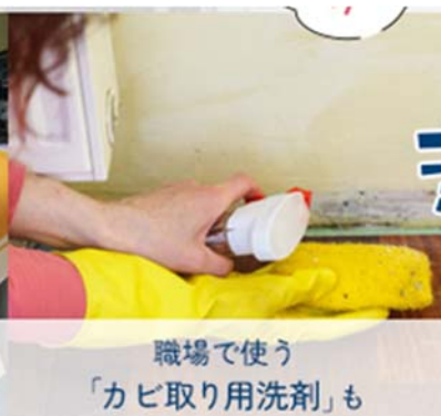
職場で使う 「カビ取り用洗剤」も