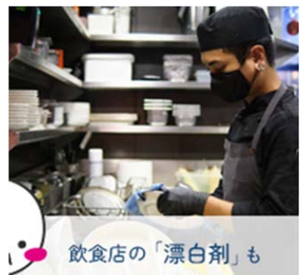
飲食店の「漂白剤」も