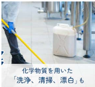
化学物質を用いた 「洗浄、清掃、漂白」も