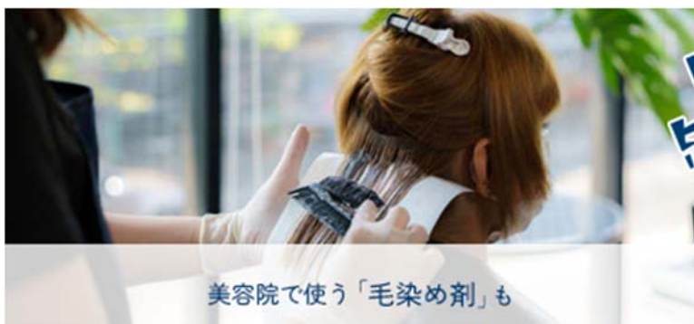
美容院で使う「毛染め剤」も