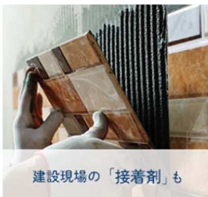
建設現場の「接着剤」も